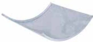
• TAPA CURVA EXTERIOR (CVE)