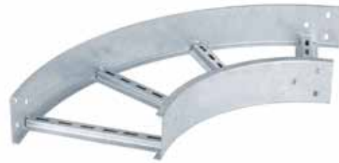
• EPC CURVA HORIZONTAL (CH)