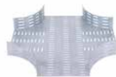
• BPC RAN - CURVA CRUZ (CX)