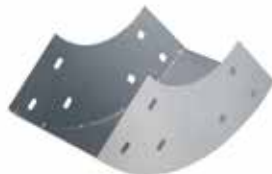
• BPC LISA - CURVA VERTICAL - INTERIOR (CVI)