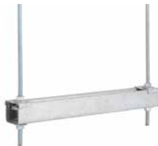
• SOPORTE TRAPECIO