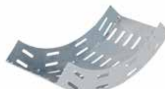
• BPC RAN - CURVA VERTICAL - INTERIOR (CVI)