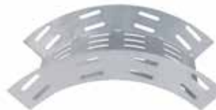
• BPC RAN CURVA VERTICAL - EXTERIOR (CVE)