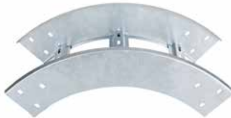
• EPC CURVA VERTICAL EXTERIOR - (CVE)