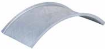
• TAPA CURVA VERTICAL INTERIOR (CVI)