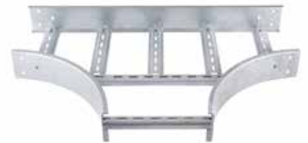
• EPC CURVA (CT)