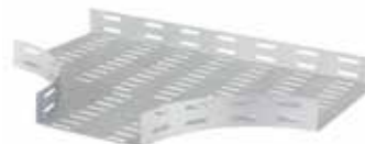
• BPC RAN - DERIVACIÓN (CT)