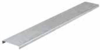
• TAPA RECTA EPC/BPC

Pestaña: 15 mm. Ancho: Desde 50 Hasta 1000 mm.