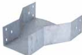
• BPC LISA - REDUCCIÓN CENTRAL