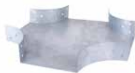
• BPC LISA - CURVA CRUZ (CX)