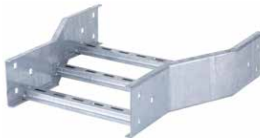
• EPC REDUCCIÓN CENTRAL