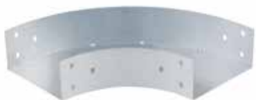
• BPC LISA - CURVA HORIZONTAL - (CH)