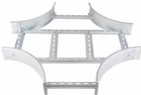
• EPC CURVA CRUZ (CX)