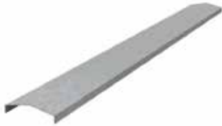
• TAPA 2 AGUAS