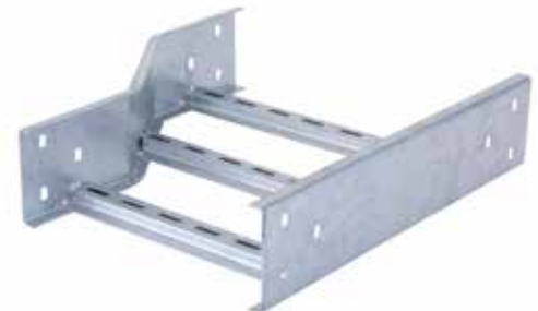
• EPC REDUCCIÓN DERECHA O IZQUIERDA

Nuestros productos Tramos rectos o curvas incluyen, un Par de Eclisas, con sus respectivos pernos y tuercas NO INCLUYE GOLILLAS.