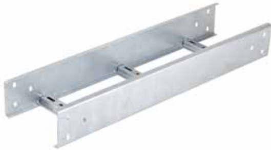
• EPC RECTA