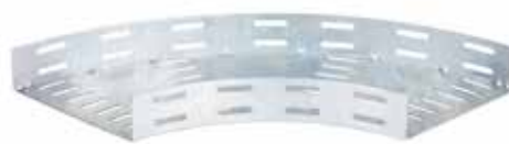
• BPC RAN - CURVA HORIZONTAL - (CH)