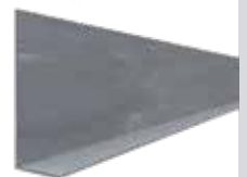
• SEPARADOR EPC/BPC