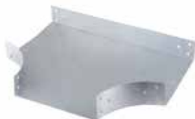
• BPC LISA - DERIVACIÓN (CT)