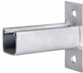
• SOPORTE MURO SIMPLE