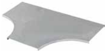
• TAPA DERIVACIÓN (CT)