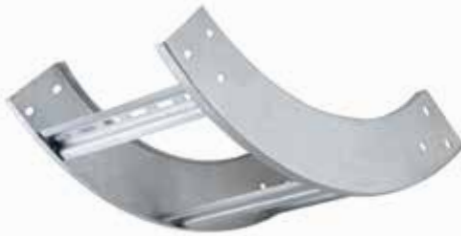
• EPC CURVA VERTICAL INTERIOR - (CVI)