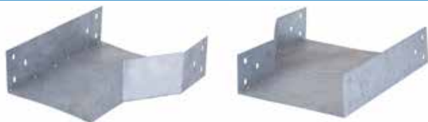
• BPC LISA - REDUCCIÓN DERECHA O IZQUIERDA