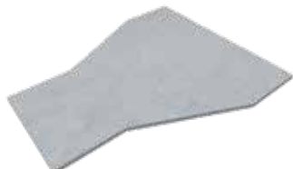
• TAPA REDUCCIÓN CENTRAL