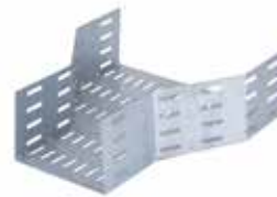
• BPC RAN - REDUCCIÓN CENTRAL