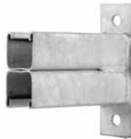
• SOPORTE MURO DOBLE