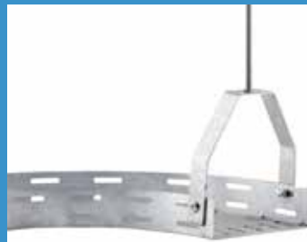
• SOPORTE ESTRIBO