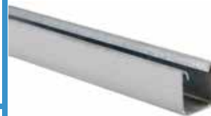
• RIEL RUC