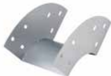
• BPC LISA CURVA VERTICAL - EXTERIOR (CVE)