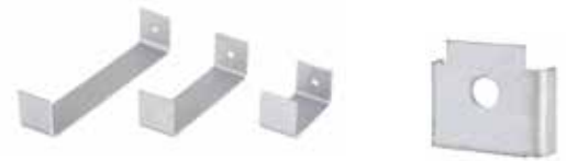
• CLIP DE FIJACIÓN TAPA